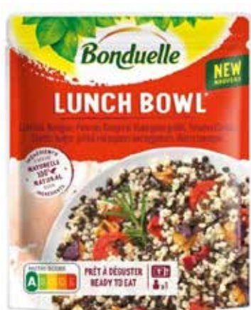
Lunch bowl - Vegan

Notre promesse est possible grâce au travail de proximité et de confiance réciproque avec nos 2 250 partenaires agriculteurs, partout dans le monde. Derrière nos 4 marques (Bonduelle, Cassegrain, Globus, Ready Pac Bistrot), 11 900 collaborateurs (dont 37% en France) et tout un écosystème de parties prenantes s'engagent au quotidien pour offrir une alimentation saine, durable et accessible au plus grand nombre. Nos produits prêts à l'emploi sont cultivés sur 73 000 hectares et commercialisés dans 100 pays, pour un chiffre d'affaires de 2 892 M€.