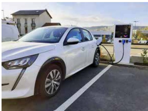
Tiny : Borne polyvalente, Tiny vous permet de regagner 100km d'autonomie en 30 minutes.

Notre matériel est éligible au programme Advenir, piloté par l'AVERE France.