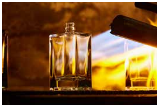
L'usine Verescence de Mers-les-Bains produit 200 millions de flacons par an

française comprend trois sites de production, dont un pour la fabrication du verre à Mers-les-Bains (80) et deux pour le parachèvement à Abbeville (80) et Écouché-les-Vallées (61), et représente 50 % du chiffre d'affaires du Groupe. Tout en perpétuant son savoir-faire verrier historique, qui fait la fierté de ses 2300 collaborateurs à travers le monde, le Groupe n'a cessé d'innover en matière de process (digitalisation, automatisation) et de produits (verre recyclé, verre allégé). Face aux enjeux du réchauffement climatique, Verescence œuvre activement pour décarboner l'industrie du verre en visant la neutralité carbone en 2050.