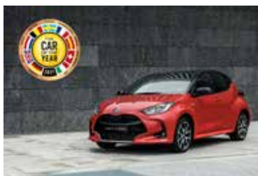
Toyota Yaris et Yaris Cross : les 2 modèles « made in France »