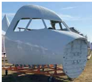
Section de fuselage avant A320 assemblée à Airbus Atlantic Méaulte

Airbus Atlantic s'appuie sur l'expertise technique des ingénieurs de son Bureau d'Études, comme sur ses 9 sites et filiales en France et ses 7 filiales à l'international. Son implantation mondiale lui confère une grande réactivité et une forte compétitivité, pour assurer la