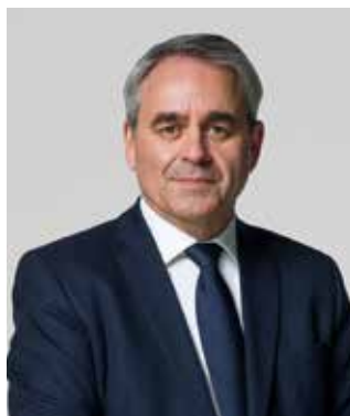
Xavier BERTRAND Président de la Région Hauts-de-France

Il n'est pas si fréquent qu'une exposition soit entièrement consacrée à des entreprises, et je suis fier que l'on puisse, en partenariat avec la Préfecture de région, mettre en valeur et présenter au public, à travers cette belle sélection, le dynamisme économique de notre région. Je la prends aussi comme un hommage rendu aux femmes et aux hommes, dirigeants, artisans, ouvriers, collaborateurs, apprentis qui, par leur travail, leur savoir-faire et leur talent fabriquent et conçoivent au quotidien, en Hauts-de-France, bon nombre de produits emblématiques de notre économie et de notre richesse nationale.