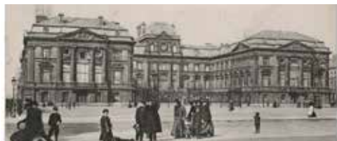
Promenade sur la place de la République - XVIIIe

La pose de la première pierre s'effectue le 15 août 1865 à l'occasion de la fête de l'Empereur. Le préfet Séguier s'installe dans le bâtiment le 12 août 1872, mais les travaux durent jusqu'en 1874.