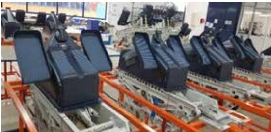
Palonnier, commandes de vol pour actionner la gouverne et le frein sol de l'avion.

ARESIA est au service des plus grands donneurs d'ordres du monde de l'Aéronautique, tels que AIRBUS, DASSAULT AVIATION, THALES, l'OTAN, les ministères chargés de la Défense en France (DGA, DMAé, ...), aux Etats-Unis (Sierra Nevada, Textron, US NAVY, US ARMY, ...), en Inde (DRDO, IAF, ...) ainsi que bien d'autres.