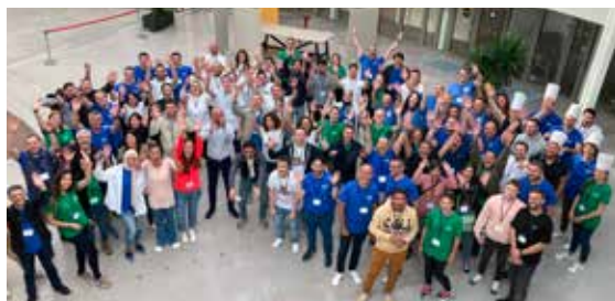
Collaborateurs Avril

BIOTFUEL, à Venette, est un projet de R&D pour la production de biocarburants avancés, notamment pour l'aviation de demain. Il a permis de valider la technologie de transformation de résidus de bois et résidus agricoles, par voie thermo-chimique.