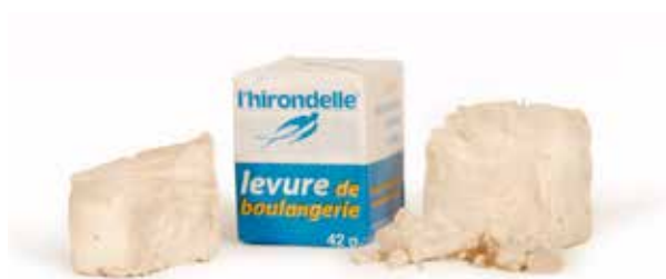
L'hirondelle - 42 g

Lesaffre – Entreprendre ensemble pour mieux nourrir et protéger la planète.