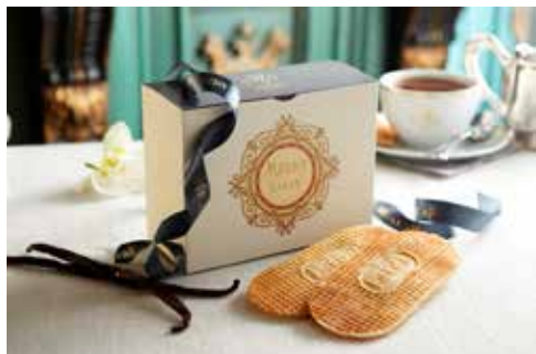
La gaufre Méert, une gourmandise iconique de la Maison depuis 1849

Aujourd'hui célébrée par les plus fins gourmets tout autour du monde, pour l'excellence de sa gaufre mais aussi pour ses recettes soigneusement préservées depuis plus de 4 siècles, la maison Méert cultive avec passion et créativité, le plus délicieux des péchés, l'Art de la gourmandise.