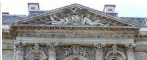
Fronton sculpté (aigle impérial protégeant le "N" napoléonien)