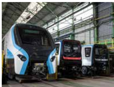
Le train RER NG et le métro MP14 sur les lignes de production Alstom