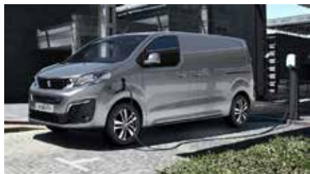
Le Peugeot e-Expert est l'un des véhicules de la famille « K-Zéro » produite à Hordain

Le Groupe Stellantis est présent sur tous les continents, avec l'objectif de devenir la plus grande « tech company » de mobilité durable, en termes de qualité et non de taille, tout en créant encore plus de valeur pour l'ensemble de ses partenaires et des communautés au sein desquelles il opère.