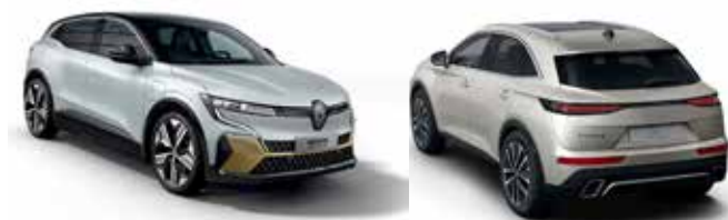
Pare-chocs Mégane E-Tech et Hayon DS7 produits à Ruitz et Flers-En-Escrebieux

À cette échéance, 40 % du chiffre d'affaires seront issus de technologies qui ne font pas partie actuellement du portefeuille de Plastic Omnium.