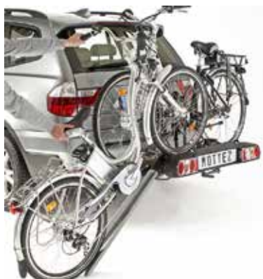
PORTE VELO ZEUS - 2 vélos électriques

Depuis 1947, spécialiste dans le travail du tube, nous concevons, dessinons, testons et fabriquons nos futurs produits !