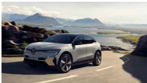
Nouvelle Megane E-Tech 100% électrique

Le projet inclut également la création de 700 emplois directs entre 2022 et 2024, ainsi que le développement d'un pôle universitaire et de formation. Renault ElectriCity c'est aussi la création de tout un écosystème dédié à l'électrique réunissant des centres de recherches, des universités, des start-ups et des fournisseurs à la pointe de leur expertise.