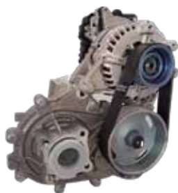
Belte drive - eAccess

Présent dans les Hauts-de-France à travers ses 3 sites d'Étaples-sur-Mer, Abbeville et Amiens, le Pôle est en capacité de réaliser un eDrive complet en termes de développement et production de la mécanique, de l'électronique et de la machine électrique qui font l'ensemble du moteur électrique.